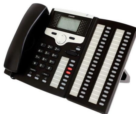
CTS-220.CL / 220.IP z konsolą CTS-338

Profil telefonu jest tworzony i przechowywany w pamięci centrali Slican dlatego z telefonu można korzystać natychmiast po włączeniu go do sieci, bez skomplikowanego i czasochłonnego programowania. Programowalne przyciski BLF pozwalają na indywidualne kreowanie funkcji, usług, czy też tworzenie listy podręcznych kontaktów. Dla wygody i zwiększenia liczby przycisków szybkiego wyboru, użytkownik może podłączyć do telefonu systemowego serii CTS-220 do 4 konsol Slican CTS-338, zwiększając ilość programowalnych przycisków do 160.