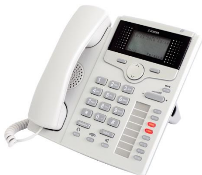
CTS-220.CL / 220.IP