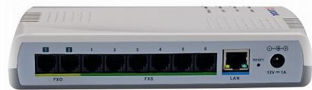
centrala Slican ITS